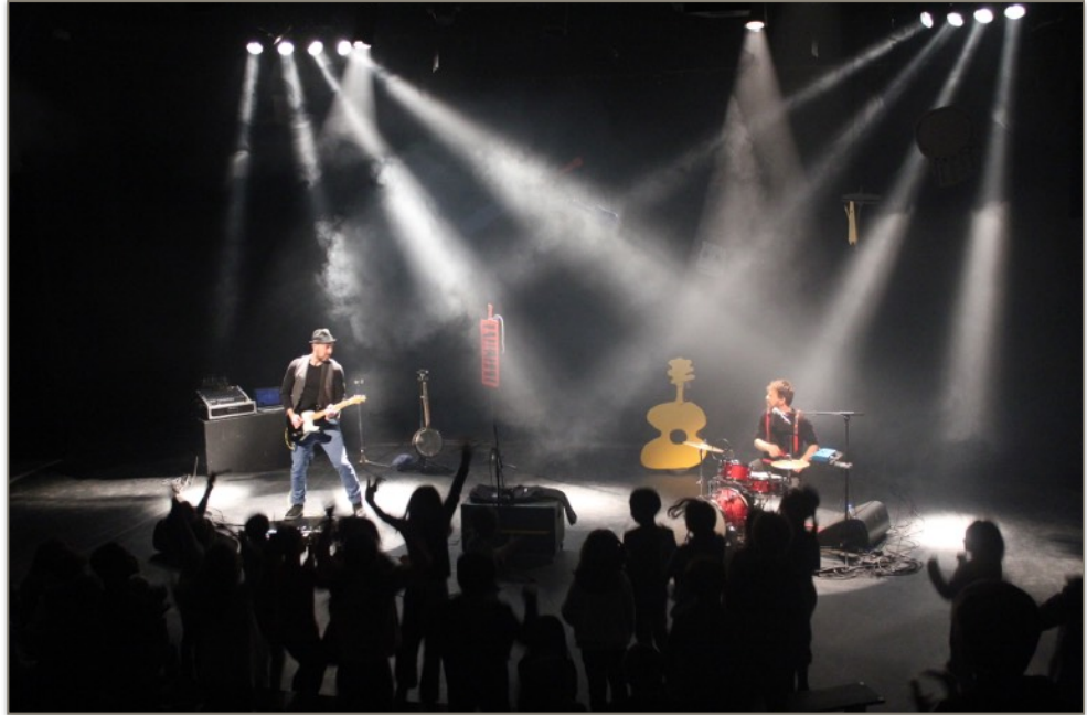
Nos jeux ont des oreilles - Cie La Goulotte